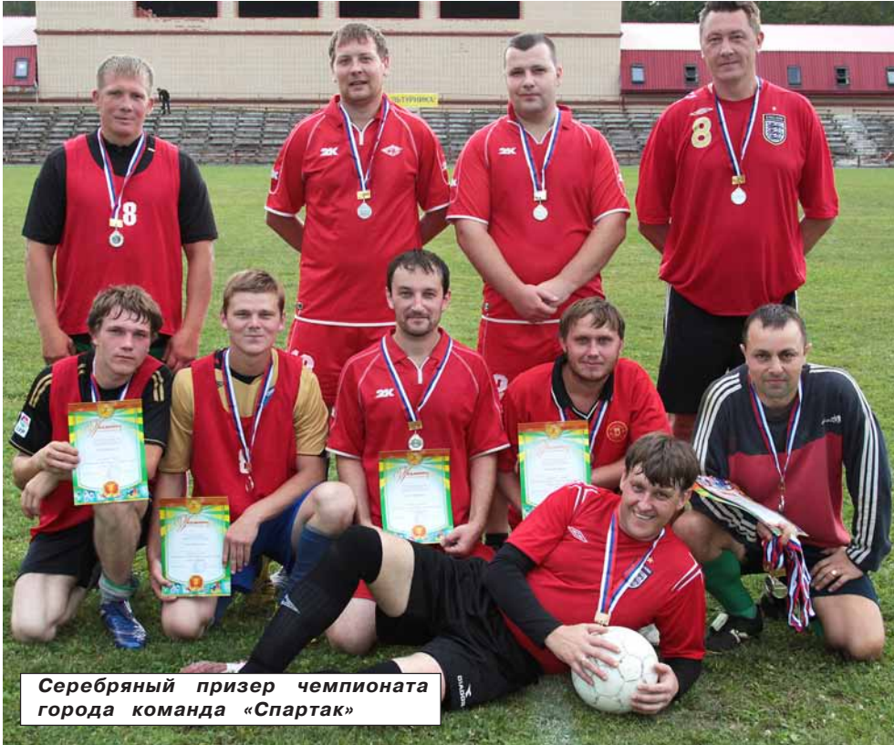
Серебряный призер чемпионата города команда «Спартак»

В спортивной жизни ярцевчан скоро произойдет значительное событие. Ярцево стало вторым городом после областного центра и Сафонова, получившим право обладать футбольным полем с искусственным покрытием.